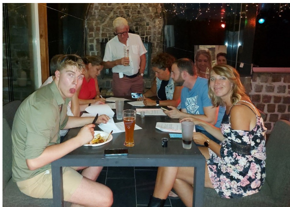
De winnaar: Groep Ramona

Ook kwamen er heel wat namen voorbij, waarbij toch nog even diep in het geheugen moest worden gegraven om niemand uit die afgelopen 35 jaar te vergeten. Namen van de acht personen die de grote trom en de acht muzikanten die de kleine trom hebben geslagen. En minimaal acht namen van Kaatsheuvelse (strikvraag) tonpraters en presentatoren die in Turfstekerland in de ton hebben gestaan.